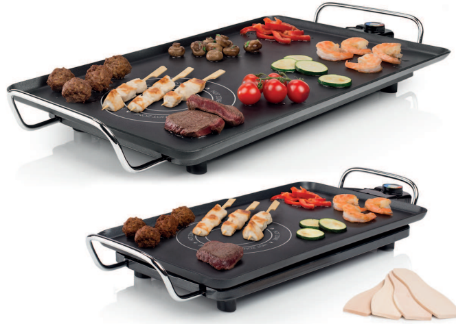
Table Chef Hot-zone / Table Chef Hot-zone XXL 01.103050.01.001 / 01.103051.01.001

PARTS DESCRIPTION / ONDERDELENBESCHRIJVING / DESCRIPTION DES PIÈCES / TEILEBESCHREIBUNG / DESCRIPCIÓN DE LAS PIEZAS / DESCRIÇÃO DOS COMPONENTES / DESCRIZIONE DELLE PARTI / BESKRIVNING AV DELAR / OPIS CZĘŚCI / POPIS SOUČÁSTÍ / POPIS SUČASTI / BESKRIVELSE AV DELER