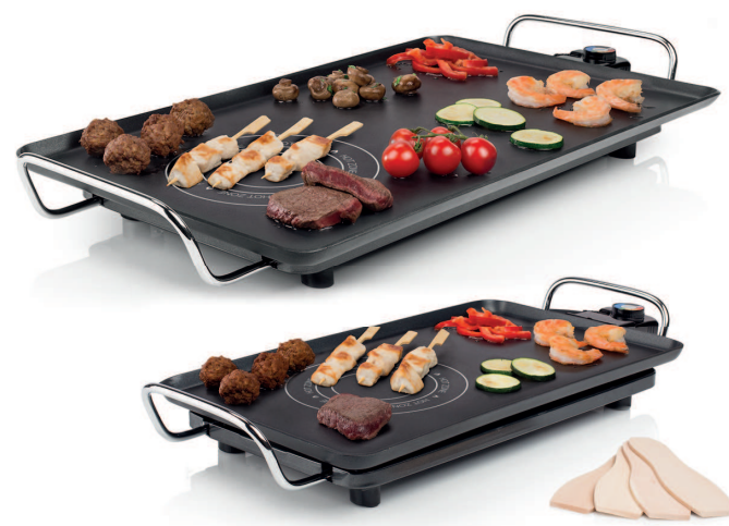
Table Chef Hot-zone / Table Chef Hot-zone XXL 01.103050.01.001 / 01.103051.01.001

PARTS DESCRIPTION / ONDERDELENBESCHRIJVING / DESCRIPTION DES PIÈCES / TEILEBESCHREIBUNG / DESCRIPCIÓN DE LAS PIEZAS / DESCRIÇÃO DOS COMPONENTES / DESCRIZIONE DELLE PARTI / BESKRIVNING AV DELAR / OPIS CZĘŚCI / POPIS SOUČÁSTÍ / POPIS SUČASTI / BESKRIVELSE AV DELER